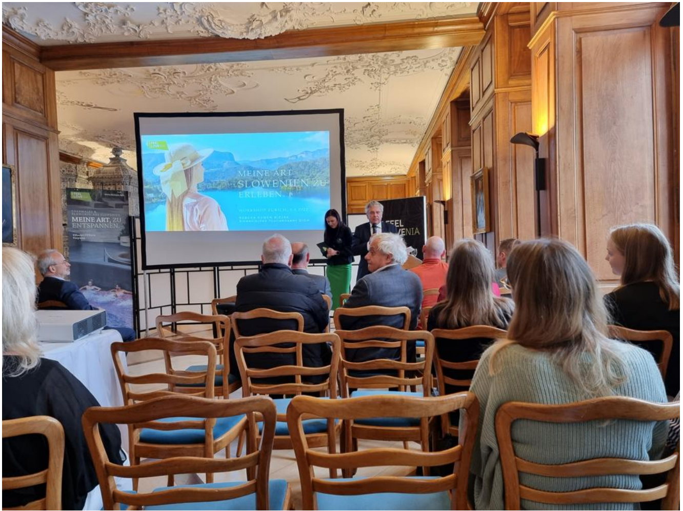
Vorträge zu Slowenien und den Heilbädern