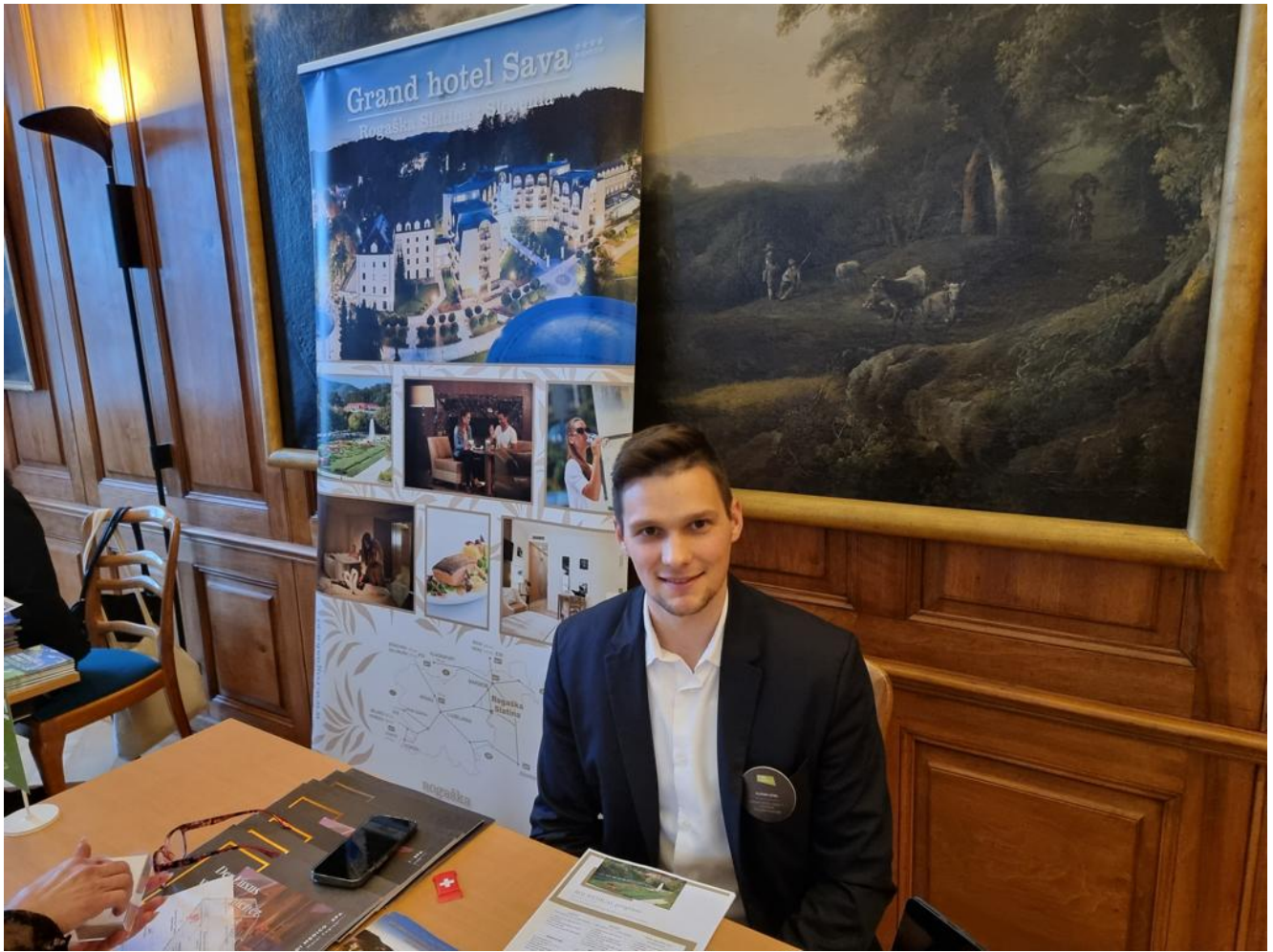
ein freundlicher Experte aus Slowenien