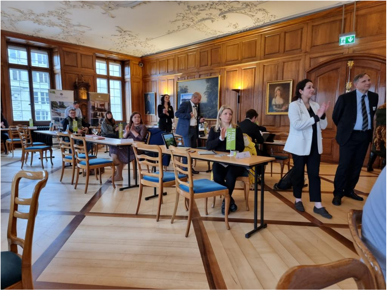
Saal mit Tourismusverkäufern